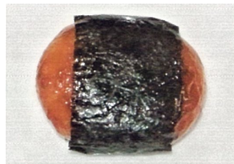
工場長の県産磯べ餅 千葉恵製菓（一関市）

盛岡市の岩手みかみ農園のいちご（とちおとめ、紅ほっぺ、他）を原料に、ダイスにカットしてかわいいゼリーにしました。無香料、無着色、酸化防止剤不使用のナチュラルゼリーです。