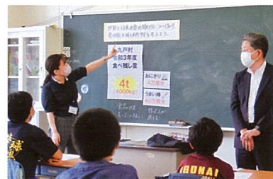
「世界と日本の関わりについて知り 食べ残しを減らす作戦を考えよう」

これからも地元生産者やオプチキキャラクターを巻き込んだ食育を展開し、地域の子どもたちが地元の素晴らしさや特産物を知ることで将来においても郷土を愛する心を育てていきたい、そして様々な食育授業を通して学校給食に関わる全てのサプライチェーンの方々「つながる給食」を実施していきたいと思っています。