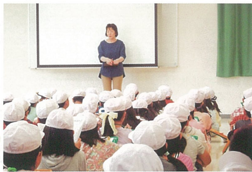
「給食センター 社会科見学」