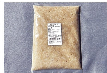
麴屋の玄米塩麹 麴屋もとみや（八幡平市）

八幡平市の風土を活かした旬の九条ネギを使用した、本格的な岩手県産ネギ塩チキンです。（季節限定販売）