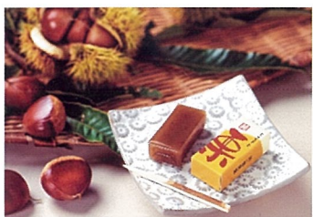
岩谷堂ひとくち羊羹 純栗 回進堂（奥州市）

地域の特産品をパウダーにし、スナック菓子にしました。今回は、八幡平市産ほうれん草、久慈市産ほうれん草、盛岡市産アロニアを販売しました（限定商品）※画像は盛岡市産アロニア・はちみつバージョンです。