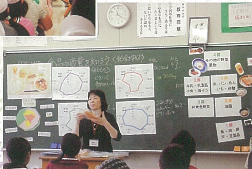
「自分の食品の適量を知ろう」