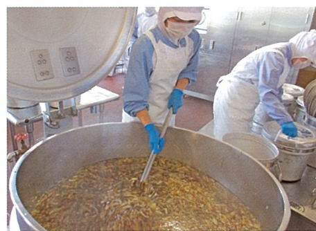
沖縄給食調理風景