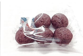
musubit（ご当地カスタム） 小島製菓（釜石市）

豚肉は畜産王国いわての純情豚を使用しています。食肉加工専門店いわちくが学校給食用に開発した、岩手県学校栄養士協議会推薦商品です。