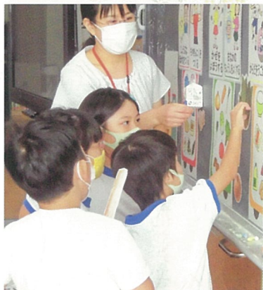
「なんでもたべるとどんなよいことがあるかな」