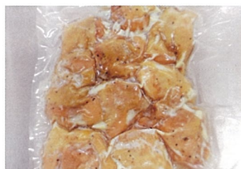
県産鶏の九条ネギ塩焼き 山長ミート（二戸市）

八幡平市の風土を活かした旬の九条ネギを使用した、本格的な岩手県産ネギ塩チキンです。（季節限定販売）