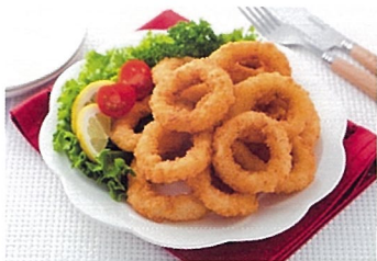
岩手県産イカリングフライ 共和水産（宮古市）

昭和58年創業以来、イカにこだわり尽くしてきた共和水産のイカ王子が、三陸北部沖で水揚げされたするめいかをリング状にカットしフライにしました。給食用に定数入りです。