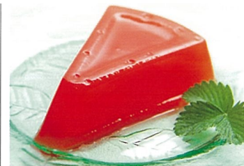
滝沢スイカゼリー 岩手県産（矢巾町）

岩手県産もち粉を使用したモチモチの生地を特製醤油タレに漬けて海苔を巻き仕上げた、工場長自慢の一品です。（季節限定商品です）