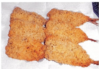
岩手県産いわしGABAN香草グリエ 小豆嶋漁業（大槌町）

県内一の出荷量を誇る岩手県滝沢市産のスイカ（アートファーム）を使用し、爽やかな果汁と甘みがある食感のゼリーです。（季節限定商品です）