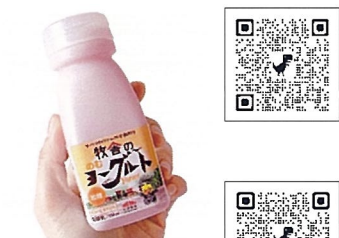
牧舎のむヨーグルト 松ぼっくり（雫石町）

昔ながらの製法にこだわり、国産の新栗を1粒1粒丁寧に収穫し、栗と砂糖のみで練り上げた贅沢な栗ようかんの一口サイズの商品です。