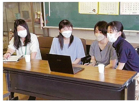
うるま市立学校給食センターとオンライン交流