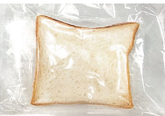
冷凍県産もち姫食パン PanoPano（盛岡市）

三陸産のマイワシにハーブ風味を付けたパン粉で衣付けしています。小豆嶋漁業、(株)GABAN、岩手県学校給食会の共同開発商品です。