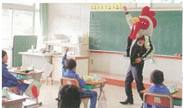
「オリジナルカレーを作ってSDGsを学ぼう！」