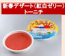
新春デザート(紅白ゼリー) トーニテ

お正月をイメージした紅白ゼリーです。いちご果汁とクランベリー果汁を使った赤ゼリーと白ゼリーの2層ゼリーです。