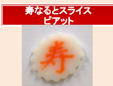
寿なるとスライス ピアット

【1月限定商品】 なるとの「の」字を「寿」にしました。3mm幅スライスで、1本約65枚です。無リンのすり身を使用しています。「祝なると」もご利用ください。 産地:北海道・タイ ㄨ切 11/27 加工地:静岡県 1本160g(約65枚)