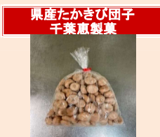
県産たかきび団子 千葉恵製菓

※上白糖は酵素を水に溶かす際に微量使用し、もち生地の甘みにはほとんど影響を与えません。 (大豆)