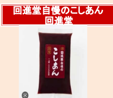
回進堂自慢のこしあん 回進堂

※上白糖は酵素を水に溶かす際に微量使用し、もち生地の甘みにはほとんど影響を与えません。 (大豆)