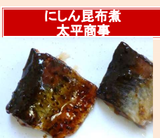
にしん昆布煮 太平商事

【11月～3月特売】 にしん独特のくせを無くすために、レモン果汁と刻んだ昆布を加えた甘口のタレで味付けしました。 産地:ロシア・アメリカ他 加工地:滋賀県 ポイル 40g 50g