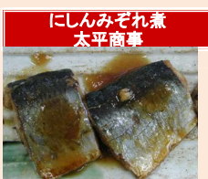
にしんみぞれ煮 太平商事

【11月～3月特売】 春告魚と呼ばれる早春から初夏にかけてが旬のにしんを使用しています。2枚おろしのレトルトで、骨も食べられます。 産地:ロシア・アメリカ他 加工地:滋賀県 ポイル 40g 50g