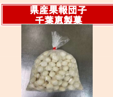
県産果報団子 千葉恵製菓

※上白糖は酵素を水に溶かす際に微量使用し、もち生地の甘みにはほとんど影響を与えません。 (大豆)