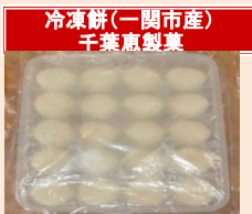
冷凍餅(一関市産) 千葉恵製菓

岩手県産のもち米のみを使用した餅生地です。自然解凍するだけで美味しいお餅が楽しめます。